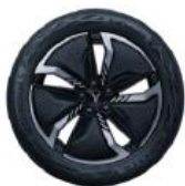
ЛЕГКОСПЛАВНЫЕ КОЛЁСНЫЕ ДИСКИ R20 «ИСКРЯЩИЙСЯ ЧЁРНЫЙ» С АЭРОДИНАМИЧЕСКИМ ДИЗАЙНОМ