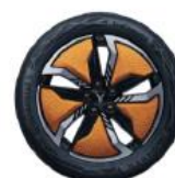
ЛЕГКОСПЛАВНЫЕ КОЛЁСНЫЕ ДИСКИ R20 «ЯНТАРНОЕ ЗОЛОТО» С АЭРОДИНАМИЧЕСКИМ ДИЗАЙНОМ