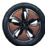
ЛЕГКОСПЛАВНЫЕ КОЛЁСНЫЕ ДИСКИ R20 «БРОНЗОВЫЙ» С АЭРОДИНАМИЧЕСКИМ ДИЗАЙНОМ