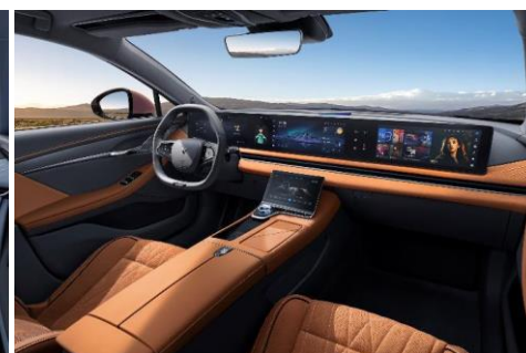
КОРИЧНЕВЫЙ С ЭЛЕМЕНТАМИ ТЁМНОГО ЦВЕТА