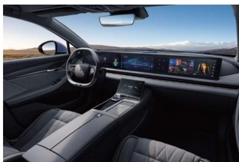
ЧЁРНЫЙ С ЭЛЕМЕНТАМИ СЕРОГО ЦВЕТА