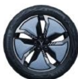
ЛЕГКОСПЛАВНЫЕ КОЛЁСНЫЕ ДИСКИ R20 «НЕБЕСНО-ГОЛУБОЙ» С АЭРОДИНАМИЧЕСКИМ ДИЗАЙНОМ