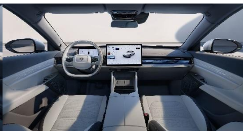
СВЕТЛО-СЕРЫЙ С ТЁМНЫМИ ЭЛЕМЕНТАМИ