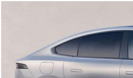
Тонировка задних стёкол