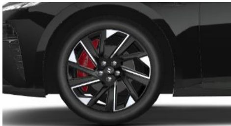
Улучшенная тормозная система с красными суппортами