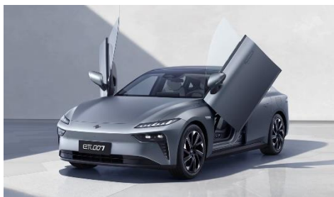
Передние подъёмные двери (для 4WD)