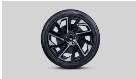
Легкосплавные диски 235/45 R19