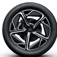
ЛЕГКОСПЛАВНЫЕ ДИСКИ 235/45 R19 «LOW DRAG»