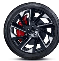
ЛЕГКОСПЛАВНЫЕ ДИСКИ 235/45 R19 «PERFORMACE RIMS»