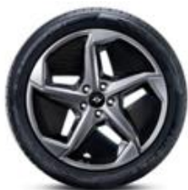
ЛЕГКОСПЛАВНЫЕ ДИСКИ 235/50 R18 «STAR WING»